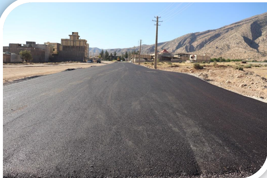
بعد از اجرای پروژه